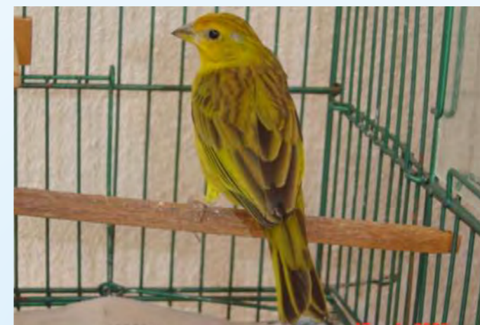
Fêmea normal região central