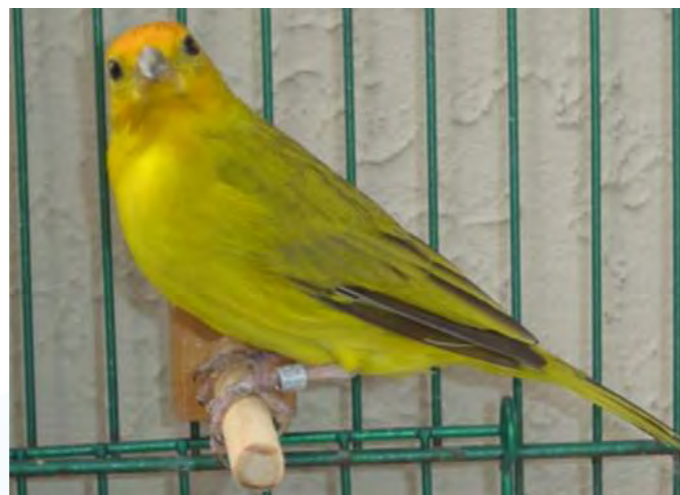
Macho normal região central

Na região central, ambos os sexos apresentam depósitos de lipocromos, sendo que existe (dependendo da região) um leve dimorfismo, sendo os machos levemente mais amarelos do que as fêmeas. Em alguns casos nota-se leves vestígios de uma coroa no alto da cabeça, próximo do bico, de tonalidade laranja.