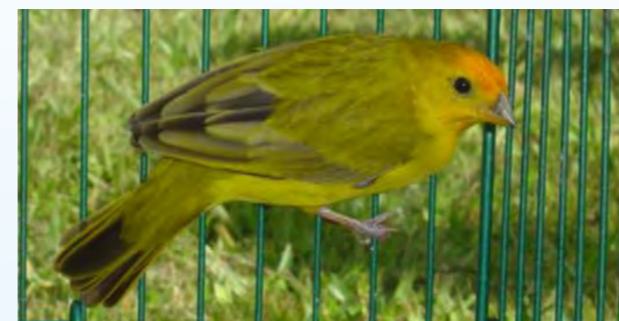
Macho normal região central

Valorizam-se os exemplares que apresentem a máxima expressão melânica, com reduzida manifestação de feo-melanina e desenho o mais nítido possível.