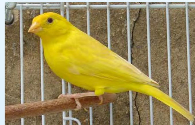
Feo diluído fêmea região central

A incidência da mutação feo nos sicalis normais, manifesta as características melânicas da plumagem, porém, mantém os olhos pretos, enquanto que quando presente nos sicalis canelas, o olho se mostrará vermelho.