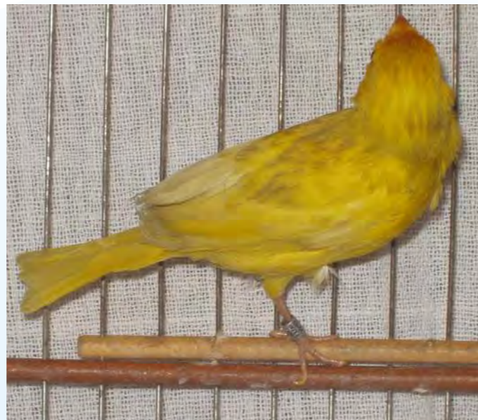
Macho canela opalino região central com boa oxidação melânica