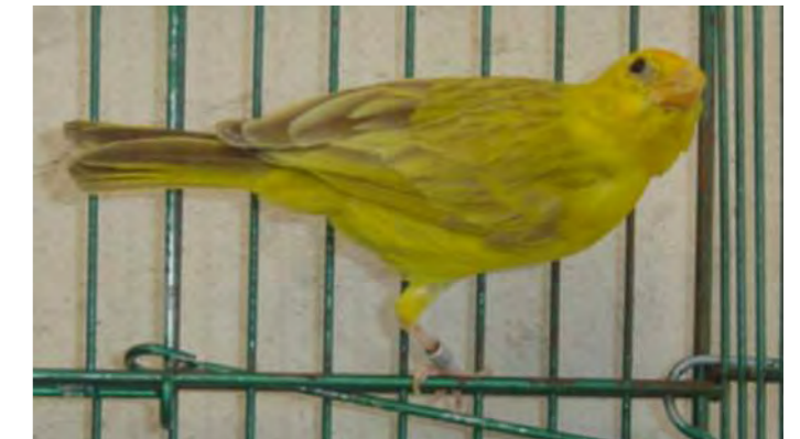
Fêmea canela região central

A mutação canela, transforma as eu-melaninas negras em eu-melaninas marrons. Valorizam-se os exemplares com maior expressão eu-melânica, mínima expressão de feo-melanina e desenho o mais nítido possível.